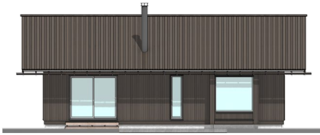
FASADE - SYD