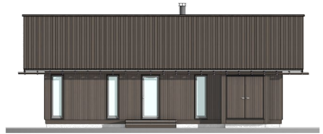
FASADE - NORD