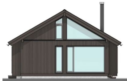
FASADE - VEST